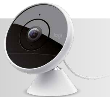
Logitech Circle 2 Sicherheitskamera: Haben Sie Haus und Hof im Blick!

Mit der Einsendung des Bestellformulars stimmt der Teilnehmer der Speicherung seiner Daten zum Versand seiner Prämie und näherer Informationen zu der Aktion zu. Teilnahmeberechtigt sind alle landwirtschaftlichen Betriebe, die die Teilnahmeunterlagen innerhalb des Aktionszeitraumes einsenden.